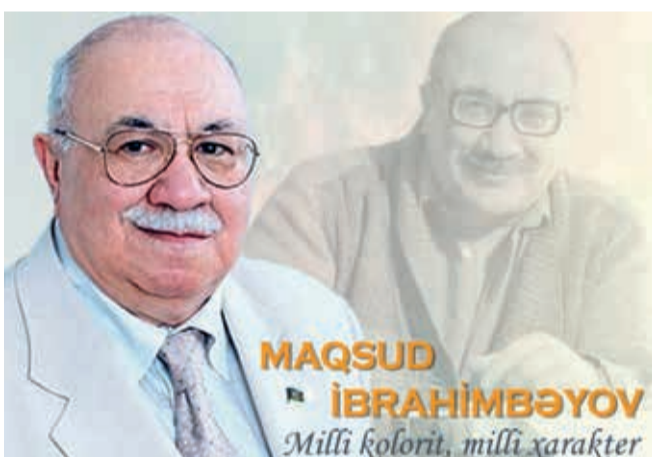
MAQŞUD İBRAHİMBƏYOV Milli kolorit, milli xarakter

Bu il Azərbaycan ədəbiyyatının görkəmli nümayəndəsi, Xalq yazıçısı, Dövlət mükafatı laureatı, tanınmış ictimai xadim Maqşud İbrahimbəyovun anadan olmasının 90 ili tamam olur. Cəfər Cabbarlı adına Respublika Gənclər Kitabxanasında “Maqşud İbrahimbəyov nəsr - milli kolorit, milli xarakter” adlı virtual kitab sərgisi hazırlanıb.