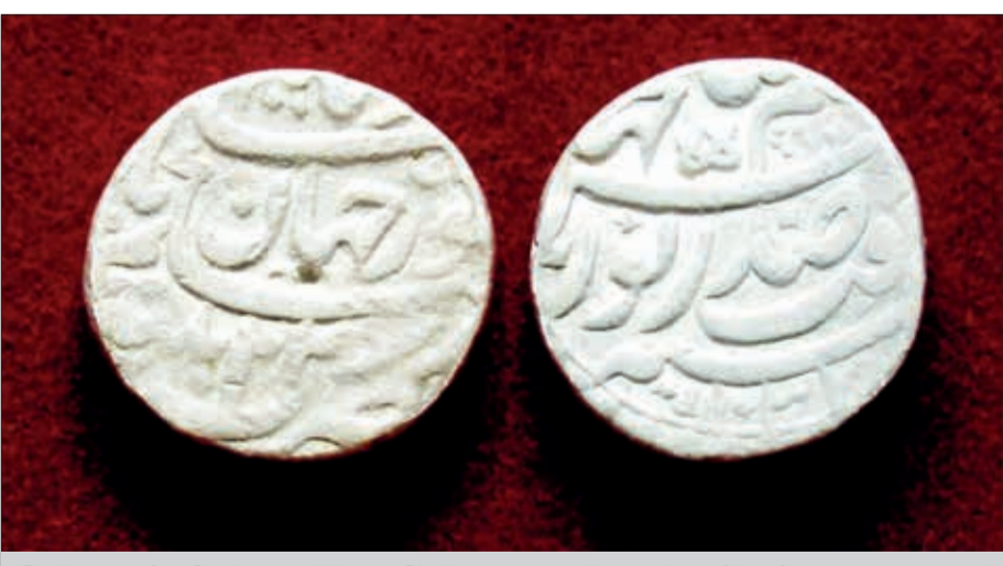
Cahangir Şah və Nur Cahanın adına kəsilmiş gümüş pul

Cahangir şah toydan sonra Mehrinisə Bəyim "Nur Mahal" ("Saray işığı"), beş il sonra isə 1616-cı ildə "Nur Cahan" ("Dünyanın işığı") titulu verir.