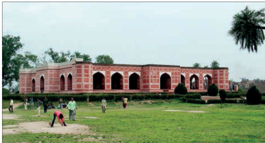
Nur Cahanın türbəsi, Şahdərə bağı. Lahor, Pakistan

şib, uzun illər imperiyani ədalətlə idarə edib.