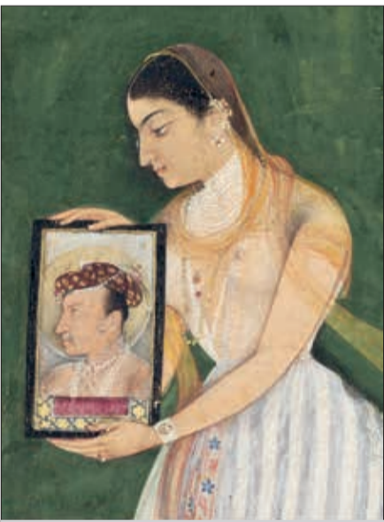
Nur Cahan, əlində Cahangir Şahın portreti, 1627

Böyük Moğol İmperiyasının (Baburilər Dövlətinin) dördüncü imperatoru Sultan Cahangir xanımı, siyasətçi və şair Mehrinisə bəyim (Sultan Cahangir evləndikdən sonra Nur Cahan bəyim) də məhz belə qüdrətli qadınlardan olub.