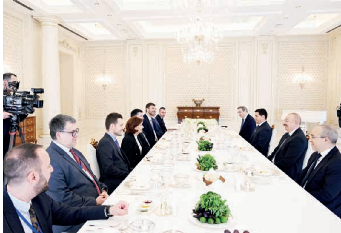
Martın 11-də Azərbaycan Respublikasının Prezidenti İlham Əliyevin Şimali Makedoniya Respublikasının Prezidenti Qordana Silyanovska-Davkova ilə lanç əsnasında geniş tərkibdə görüşü olub.