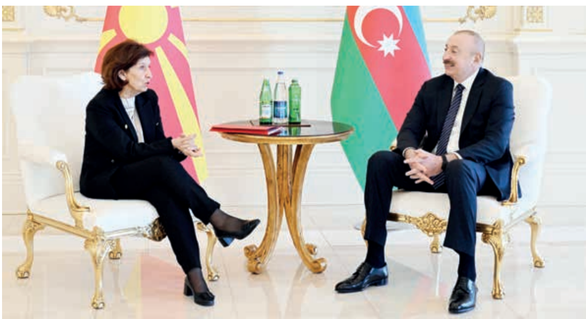
Martın 11-də Azərbaycan Respublikasının Prezidenti İlham Əliyevin Şimali Makedoniya Respublikasının Prezidenti Qordana Silyanovska-Davkova ilə təkbətək görüşü olub.