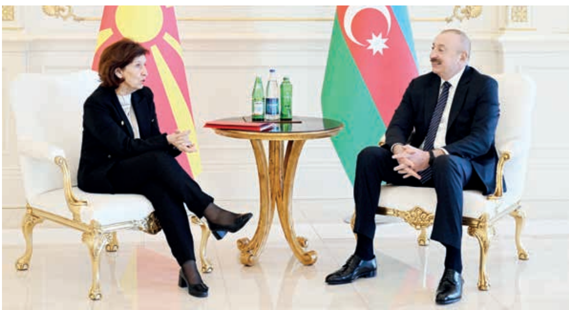
Martın 11-də Azərbaycan Respublikasının Prezidenti İlham Əliyevin Şimali Makedoniya Respublikasının Prezidenti Qordana Silyanovska-Davkova ilə təkbətək görüşü olub.