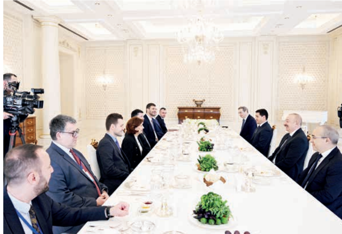
Martın 11-də Azərbaycan Respublikasının Prezidenti İlham Əliyevin Şimali Makedoniya Respublikasının Prezidenti Qordana Silyanovska-Davkova ilə lanç əsnasında geniş tərkibdə görüşü olub.