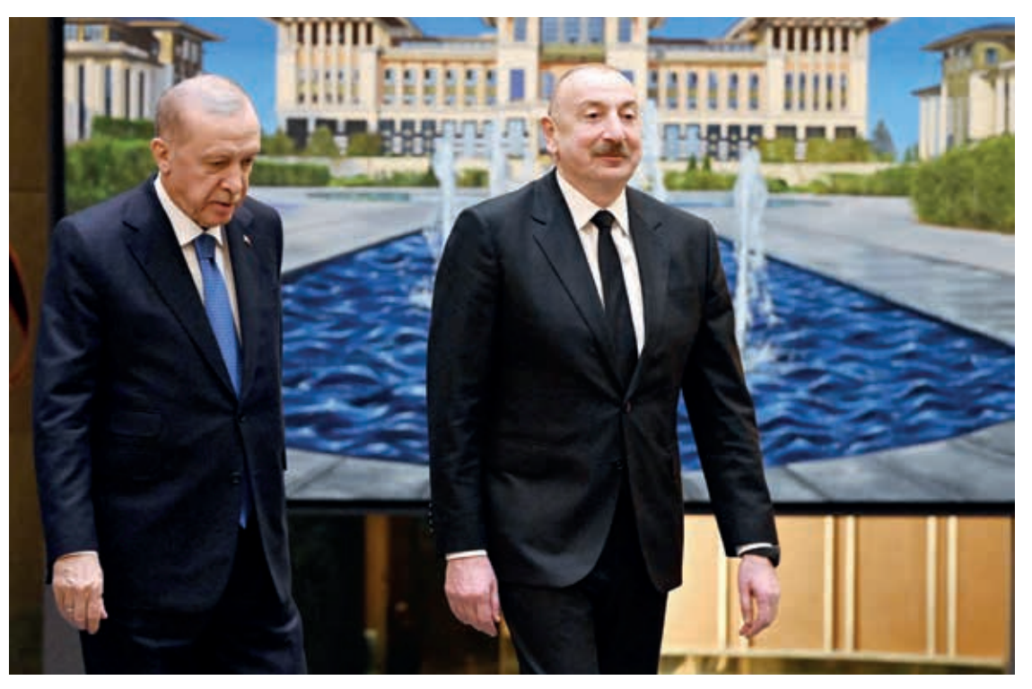
Martın 5-də Ankarada Azərbaycan Respublikasının Prezidenti İlham Əliyev və Türkiyə Respublikasının Prezidenti Rəcəb Tayyib Ərdoğan iftar süfrəsində iştirak ediblər.