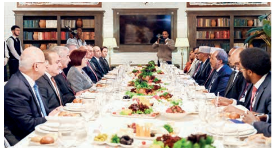
Azərbaycan Respublikasının Milli Məclisinin Sədri Sahibə Qafarova və ölkəmizdə rəsmi səfərdə olan Somali Federativ Respublikasının Prezidenti Hasan Şeyx Mahmud fevralın 13-də birgə işçi nahar ediblər.

Söhbət zamanı Azərbaycan ilə Somali arasında münasibətlərin inkişaf perspektivləri, parlamentlərarası əməkdaşlıq və