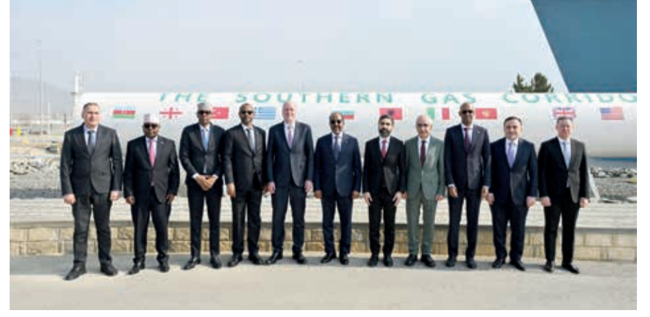
Azərbaycanda rəsmi səfərdə olan Somali Prezidenti Hasan Şeyx Mahmud Səngəçal neft terminalında olub.

Terminalda tanışlıq Xəzər regionunda bənzərsizliyi ilə seçilən Xəzər Enerji Mərkəzindən başlanıb.