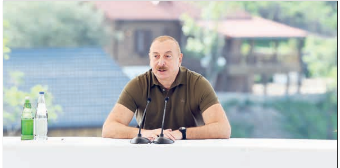
Mayın 28-də Azərbaycan Respublikasının Prezidenti İlham Əliyev Laçın şəhərinə qayıdan əhali ilə görüşüb, evlərin açılarını onlara təqdim edib. Dövlətimizin başçısı görüşdə çıxış edib.