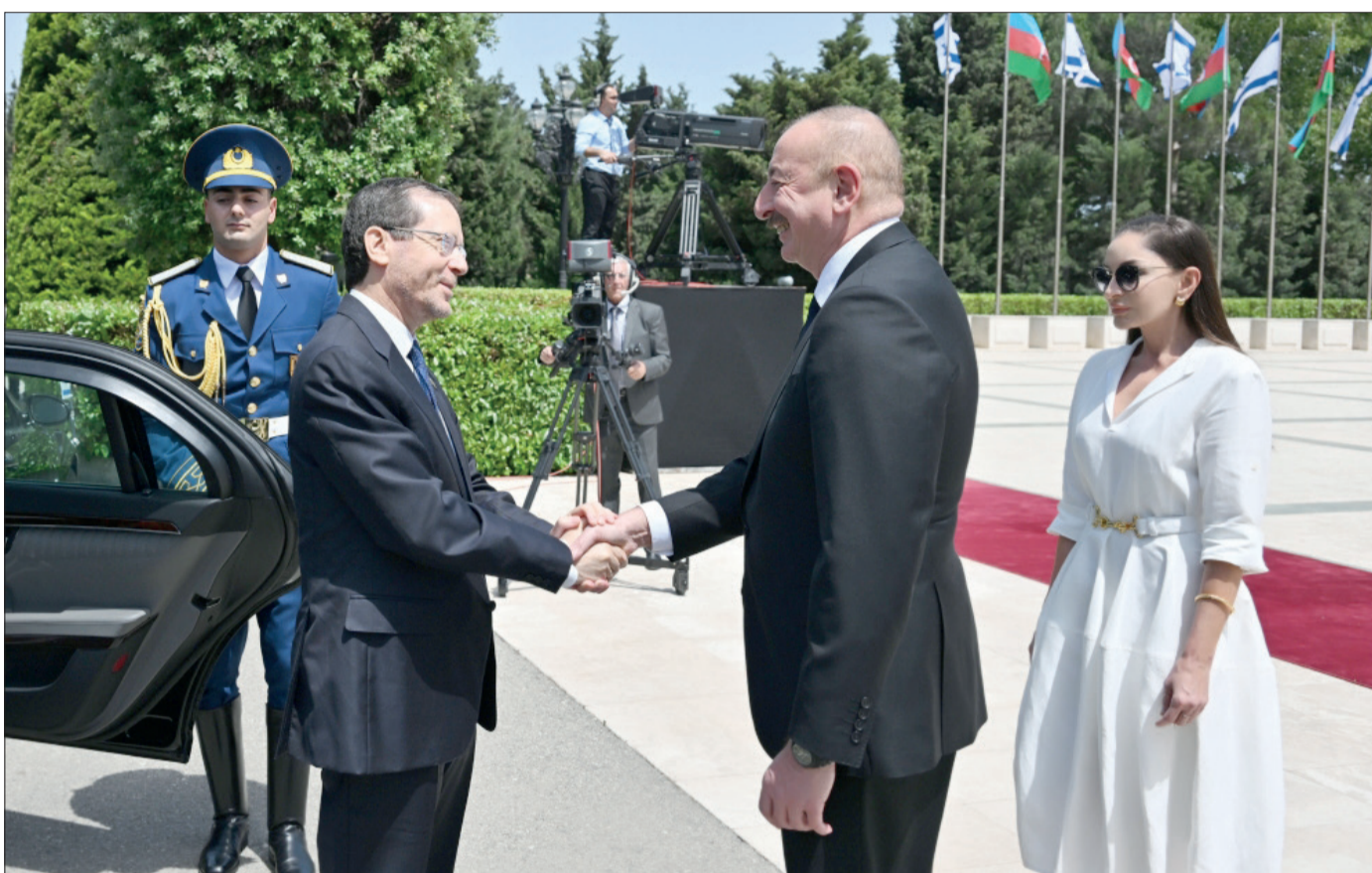
Azərbaycan Respublikasına rəsmi səfərə gələn İsrail Dövlətinin Prezidenti İsxak Hersoqu mayın 30-da rəsmi qarşılama mərasimi olub.

Hər iki ölkənin Dövlət bayraqlarının dalğalandığı meydan-da İsrail Prezidentinin şərəfinə fəxri qarovul dəstəsi düzül-müşdü.