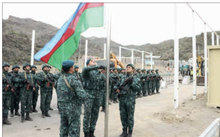
Azərbaycan Prezidenti İlham Əliyev mayın 28-də Laçın şəhərində yerli əhali ilə görüşündə Bakı ilə İravan arasındakı münasibətlərin hazırkı fazasını müəyyənləşdirəcək dolğun məzmunlu fikirlər səsləndirdi. Bu fikirlər həm bütövlükdə ölkəmizin ictimaiyyətinə məlumatlandırmaq, həm də Ermənistana və onun havadarlarına ciddi xəbərdarlıq mahiyyəti daşıdı.

Əslində, dövlətimizin başçısının söylədiklərinə növbəti xəbərdarlıq da demək mümkündür. Onu da nəzərə alaraq ki, 44 günlük müharibədən sonrakı hər xəbərdarlıq bundan nəticə çıxarılmaması müqabilində gerçəkləşən proseslərlə yadda qalıb. Deməli, Azərbaycan Prezidentinin sözünün arxasında konkret iş dayanır. Yeri gəlmişkən, cənab İlham Əliyev özü də bu məqama toxundu: "Mənim sözüm qətidir, bunu hər kəs bilir, həm Azərbaycanda, həm