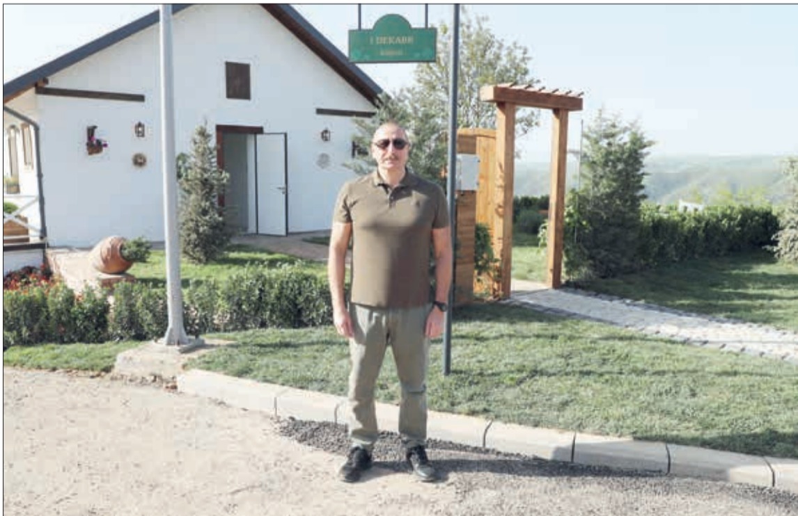
Azərbaycan Respublikasının Prezidenti İlham Əliyev mayın 28-də Laçın şəhərində "1 Dekabr" adı verilmiş küçədə lövhənin açılışını edib.

Dövlətimizin başçısına küçədə görüləcək işlər və yaradılacaq şərait barədə məlumat verildi. Bildirildi ki, 1 Dekabr küçəsi şəhərin diplomatik yolla işğaldan azad olunduğu tarixə əsasən belə adlandırılıb. Küçənin uzunluğu 1566 metr, eni isə 10