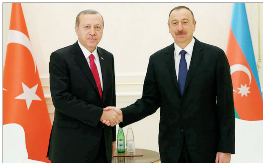
Azərbaycan Respublikasının Prezidenti İlham Əliyev mayın 28-də Türkiyə Respublikasının Prezidenti Rəcəb Tayyib Ərdoğana zəng edib.

Dövlətimizin başçısı Rəcəb Tayyib Ərdoğanı prezident seçkilərində əldə etdiyi qələbə münasibətilə təbrik edib.