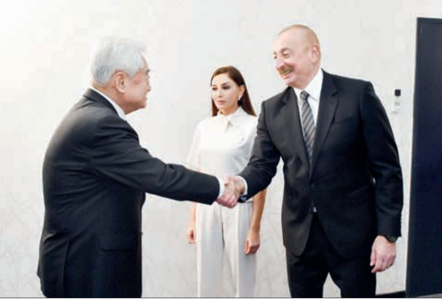
Mayın 29-da Bakıda taekvondo üzrə 26-cı dünya çempionatının açılış mərasimi olub.

Prezident İlham Əliyev və birinci xanım Mehriban Əliyeva açılış mərasimini izləyiblər