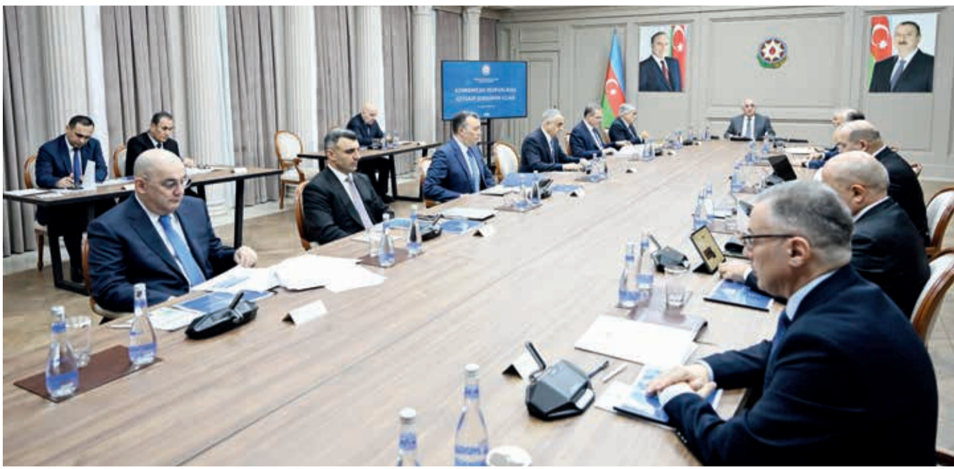
Yanvarın 27-də İqtisadi Şüranın iclası keçirilib.

Azərbaycan Respublikası İqtisadi Şurasının sədri, Baş nazir Əli Əsədovun rəhbərliyi ilə keçirilən iclasın gündəliyində Prezident İlham Əliyevin yanvarın 7-də yerli televiziya kanallarına verdiyi geniş müsahibəsindən irəli gələn tapşırıqlar, 2024-cü ilin sosial-iqtisadi inkişaf göstəriciləri və İqtisadi Şüranın 2025-ci il üzrə Fəaliyyət Planı, "Naxçıvan Muxtar Respublikasının sosial-iqtisadi inkişafına dair 2023-2027-ci illər üçün Dövlət Proqramı"nda Azad İqtisadi Zonanın (AİZ) yaradılması ilə bağlı