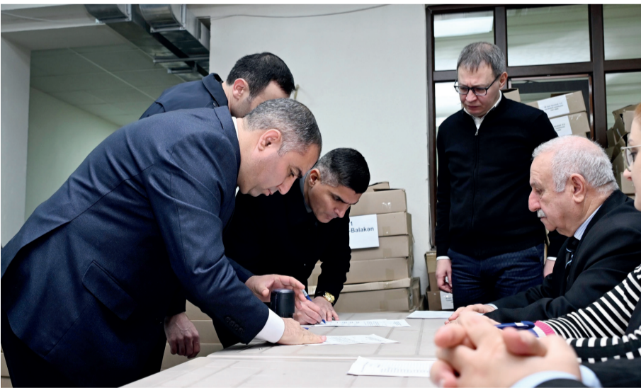
Yanvarın 29-da keçiriləcək bələdiyyə seçkiləri ilə əlaqədar seçki bülletenlərinin dairə seçki komissiyalarına paylanmasına başlanılıb.

Mərkəzi Seçki Komissiyasının üzvləri, Katibliyin əməkdaşları, o cümlədən müvafiq dairə seçki komissiyalarının sədr və katiblərinin də iştirakı ilə reallaşdırılan proses açıq və şəffaf şəkildə həyata keçirilib, müşahidəçilər, media nümayəndələri və maraqlı seçki subyektlərinin bülletenlərin paylanmasını yaxından izləyə bilmələri üçün hər cür şərait yaradılıb.