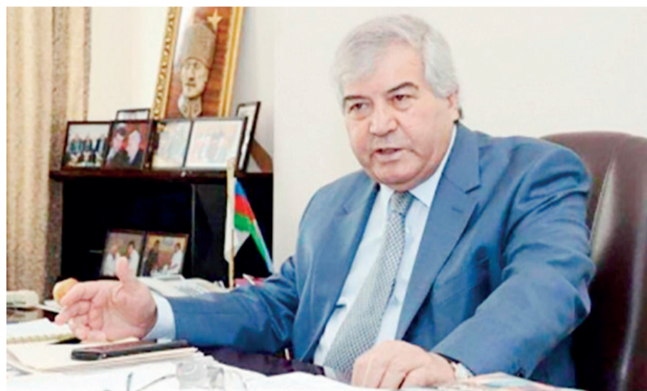
Sabir RÜSTƏMXANLI, Xalq şairi

Kitabın VI fəslində Marksist dünyagörüşünün hakim olduğu 1920-1940-cı illərin proletkult ədəbiyyatı araşdırılır. Alimin diqqət mərkəzində o dövrdə əsərləri ən çox müzakirə edilən parlaq ədəbi simalardan biri, bəlkə də birincisi olan Cəfər Cəbbarlı dayanır; onun "Od gəlini" pyesi "peyğəmbərlik və antiutopiya" tezi ilə təhlil edilir. Bu fəsildə eləcə də Birinci Türköloji Qurultayın qərarları gözənd keçirilir, Əlibəyov və orfoqrafiyanın dəyişdirilməsi barədə müəllifin irəli sürdüyü mülahizələr maraqlıdır. Cənubi Azərbaycanda ortaya çıxmış "Danışməndani-Azərbaycan" adlı məşhur kitabın müəllifi Məhəmmədəli Tərbiyətin həyat və yaradıcılığı haqqında ətraflı məlumat da həmin fəsildə yer almışdır. Göründüyü kimi, mövzu çox genişdir; müəllif dövrün biri-birindən uzaq fikir