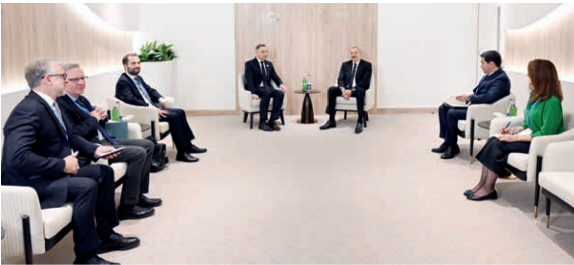
Azərbaycan Respublikasının Prezidenti İlham Əliyev noyabrın 12-də Polşa Respublikasının Prezidenti Andrey Duda ilə görüşüb.

Prezident İlham Əliyev COP29-da iştirak etdiyinə görə Andrey Duda minnətdarlığını bildirdi. Polşa Prezidenti ilə görüşlərini məmnunluqla xatırlayan dövlətimizin başçısı Andrey Duda ölkəmizə səfərinin ikitərəfli münasibətlərimizin inkişafına töhfə verəcəyinə ümidvar olduğunu dedi.