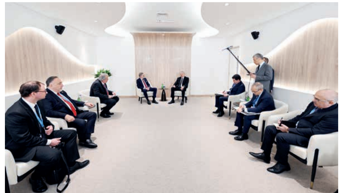
Azərbaycan Respublikasının Prezidenti İlham Əliyev noyabrın 12-də Çex Respublikasının Baş naziri Petr Fiala ilə görüşüb.

COP29 tədbirinə dəvətə görə minnətdarlığımı ifadə edən Petr Fiala Azərbaycana ilk dəfə səfər etməsindən məmnunluğunu bildirdi. Çex Respublikasının Baş naziri COP29-un yüksək səviyyədə təşkil olunduğunu vurğuladı və bununla bağlı dövlətimizin başçısını təbrik etdi. O, COP miqyasında tədbirin belə bir qısa müddətdə təşkil edilməsinin heç də asan olmadığını vurğuladı.