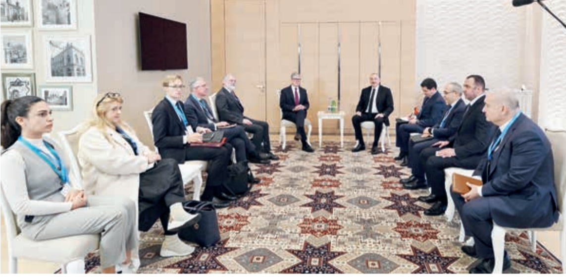
Azərbaycan Respublikasının Prezidenti İlham Əliyev noyabrın 12-də Böyük Britaniya və Şimali İrlandiya Birləşmiş Krallığının Baş naziri Kir Starmer ilə görüşüb.

Prezident İlham Əliyev bunun Britaniya Baş nazirinin Azərbaycana ilk səfəri olduğunu qeyd etdi. Bildirdi ki, bu səfər Azərbaycanla Böyük Britaniya arasında əlaqələrdə mühüm əhəmiyyət daşıyır və tarixi bir səfərdir.