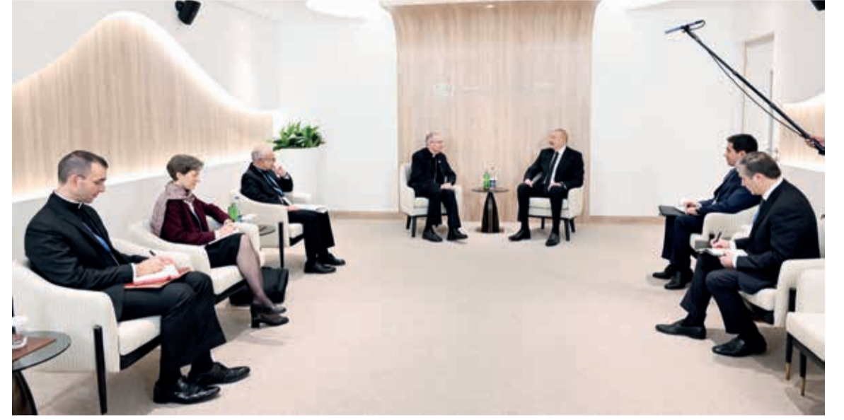
Azərbaycan Respublikasının Prezidenti İlham Əliyev noyabrın 12-də Müqəddəs Taxt-Tacın Dövlət katibi kardinal Pietro Parolin ilə görüşüb.

Söhbət zamanı Azərbaycanda müxtəlif dinlərin nümayəndələrinin dostluq və harmoniya şəraitində yaşamaları məmnunluqla qeyd olundu.