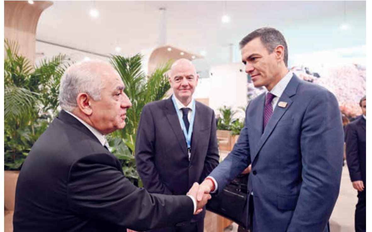
Azərbaycan Respublikasının Baş naziri Əli Əsədov noyabrın 12-də Bakıda keçirilən COP29 Liderlər Sammitinin açılış mərasimi çərçivəsində Türkiyə Respublikasının Prezidenti Rəcəb Tayyib Ərdoğan, Gürcüstanın Baş naziri İrakli Kobaxidze, Pakistan İslam Respublikasının Baş naziri Məhəmməd Şahbaz Şərif, İspaniya Krallığı Hökumətinin sədri Pedro Sançez və FIFA-nın prezidenti Canni İnfantino ilə görüşlər keçirib.

Azərbaycan Respublikasının Baş naziri Əli Əsədov həmin gün Bakıda keçirilən BMT-nin İqlim Dəyişmələri üzrə Çərçivə Konvensiyasının Tərəflər Konfransının 29-cu sessiyasının (COP29) Liderlər Sammitinin açılış mərasimi çərçivəsində İraq Respublikasının Prezidenti Əbdüllətif Camal Rəşid ilə görüşüb.