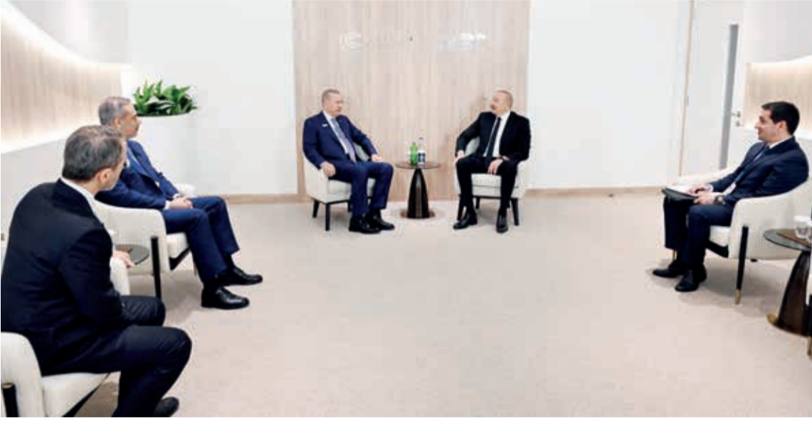
Azərbaycan Respublikasının Prezidenti İlham Əliyev noyabrın 12-də Türkiyə Respublikasının Prezidenti Rəcəb Tayyib Ərdoğan ilə görüşüb.