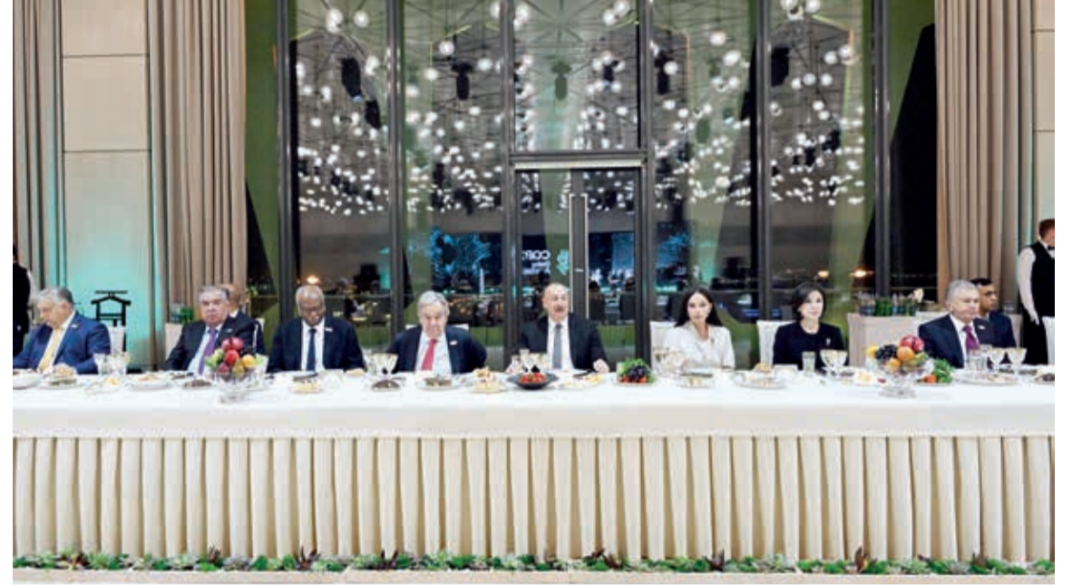
Noyabrın 12-də Bakıda, Gülüstən sarayında Azərbaycan Respublikasının Prezidenti İlham Əliyevin adından BMT-nin İqlim Dəyişmələri üzrə Çərçivə Konvensiyasının Tərəflər Konfransının 29-cu sessiyasının (COP29) Liderlər Sammitinin açılış mərasimində iştirak edən dövlət və hökumət başçılarına şərəfinə ziyafət verilib.

Prezident İlham Əliyev və birinci xanım Mehriban Əliyeva tədbirdə iştirak ediblər.