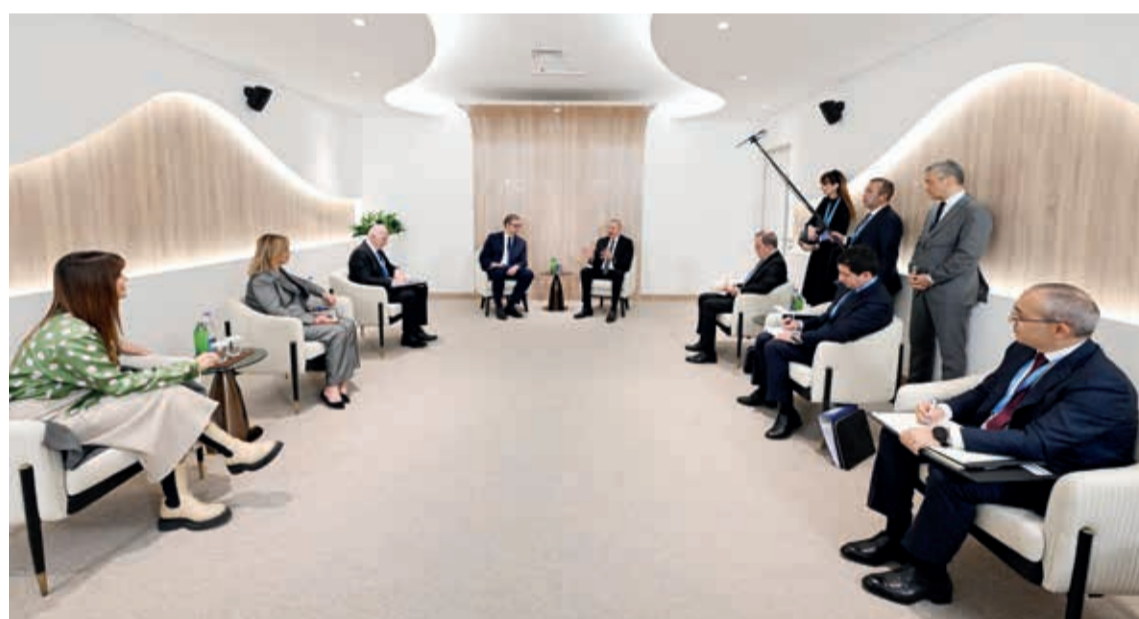
Azərbaycan Respublikasının Prezidenti İlham Əliyev noyabrın 11-də Serbiya Respublikasının Prezidenti Aleksandar Vuçiq ilə görüşüb.

Görüşdə ölkələrimiz arasında ikitərəfli münasibətlərdən məmnunluq ifadə olundu, yüksək səviyyəli qarşılıqlı səfərlərdə intensivlik qeyd edildi. Beynəlxalq təşkilatlarda əməkdaşlıq, həmçinin sənaye, infrastruktur, səmərəlilik, bərpaolunan enerji sahələrində əməkdaşlıqla bağlı fikir mübadiləsi aparıldı.