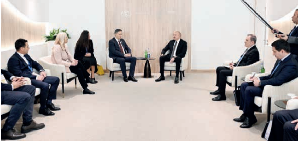
Azərbaycan Respublikasının Prezidenti İlham Əliyev noyabrın 11-də Bosniya və Herseqovinanın Rəyasət Heyətinin Sədri Denis Beçiroviç və üzvü Jelka Tsviyanoviç ilə görüşüb.

COP29-a dəvətə görə dövlətimizin başçısına minnətdarlığını bildiren Bosniya və Herseqovinanın Rəyasət Heyətinin Sədri Denis Beçiroviç bu tədbirin Azərbaycanca keçirilməsi ilə bağlı təbriklərini çatdırdı və onun uğurlu olacağına əminliyini bildirdi.