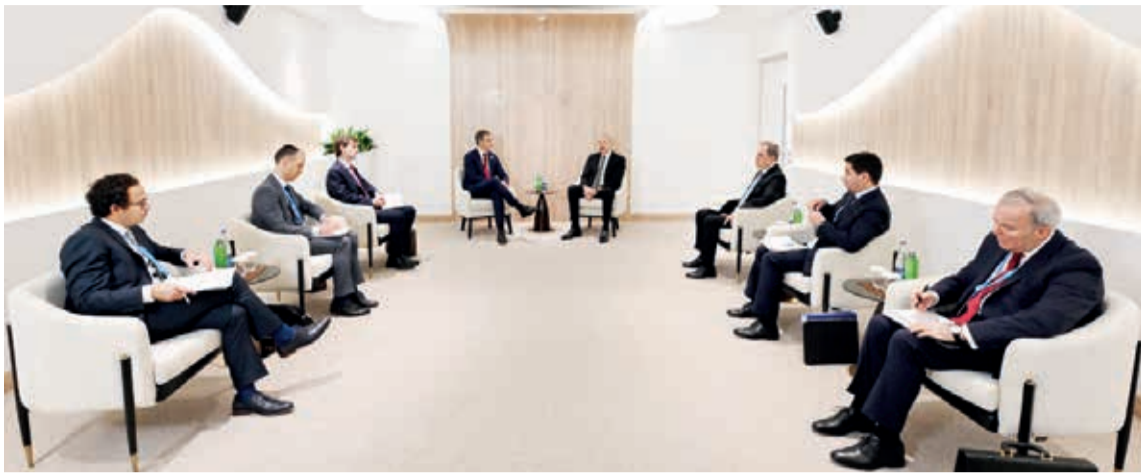
Azərbaycan Respublikasının Prezidenti İlham Əliyev noyabrın 11-də Belçika Krallığının Baş naziri Aleksandr De Kro ilə görüşüb.

Belçika Krallığının Baş naziri COP29-un keçirilməsi münasibətilə təbriklərini çatdıraraq, iqlim dəyişmələri ilə bağlı məsələlərin müzakirəsi üçün bu tədbirin çox önəmli olduğunu dedi.