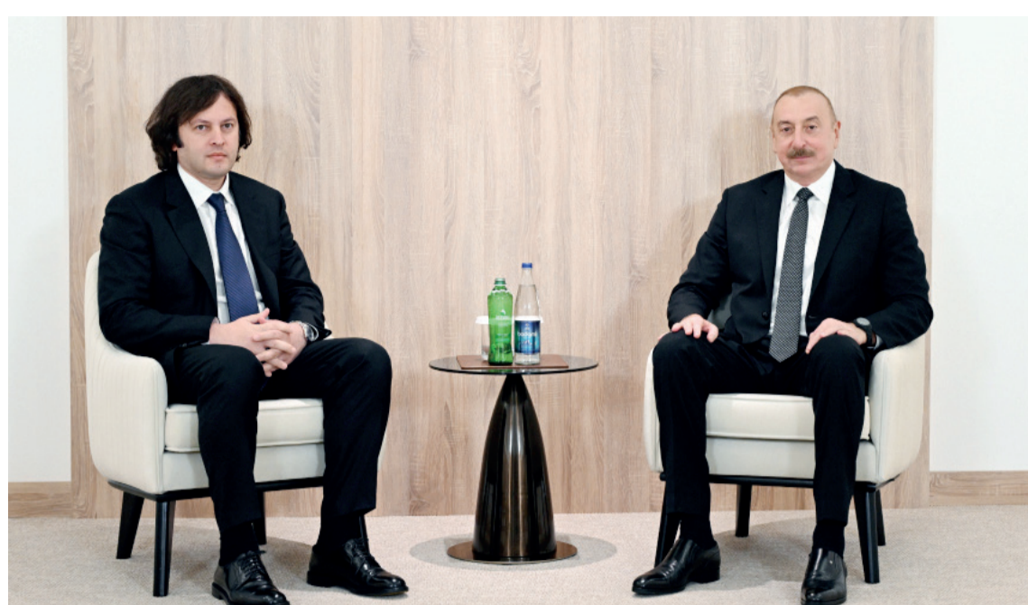
Azərbaycan Respublikasının Prezidenti İlham Əliyev noyabrın 11-də Gürcüstanın Baş naziri Irakli Kobaxidze ilə görüşüb.

Prezident İlham Əliyev Gürcüstanda keçirilmiş parlament seçkilərində "Gürcü Arzusu – Demokratik Gürcüstan" Partiyasının qələbəsi münasibətilə Irakli Kobaxidzeni təbrik edərək ona gələcək fəaliyyətinə uğurlar arzuladı. Bu seçkilərin nəticələrinin gürcü xalqının iradəsinə əks etdirildiyini vurğuladı.