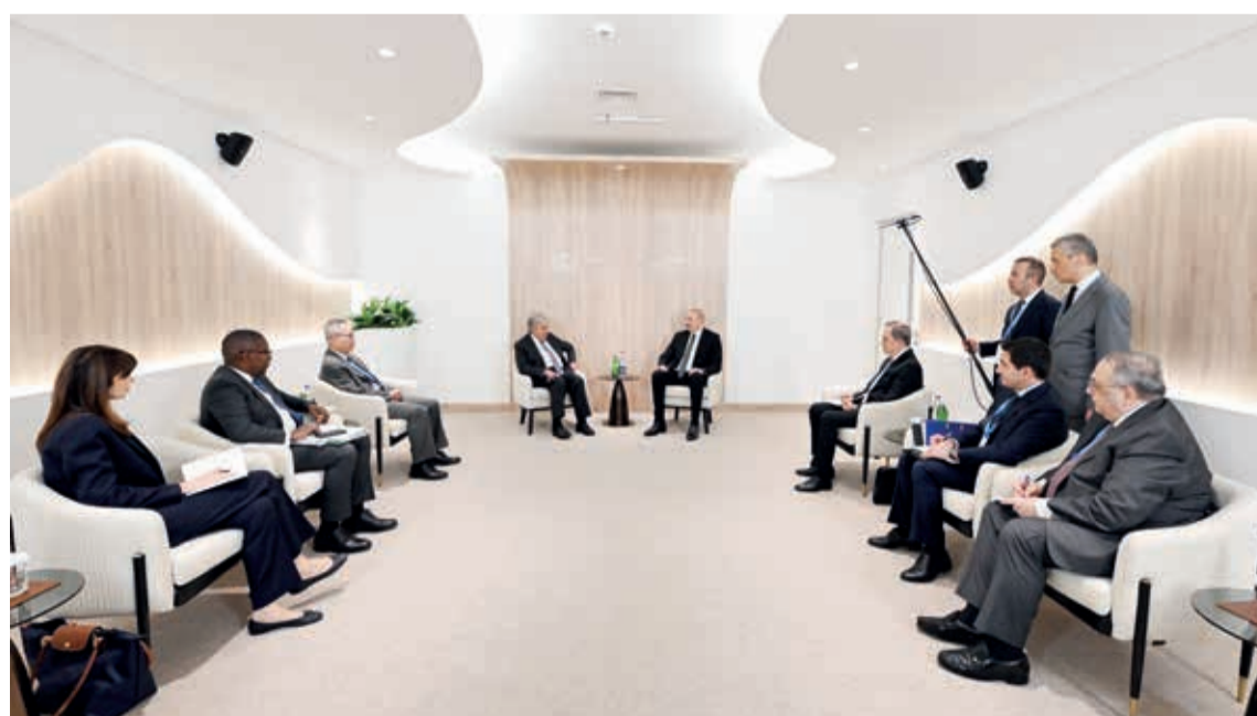
Azərbaycan Respublikasının Prezidenti İlham Əliyev noyabrın 11-də Birləşmiş Millətlər Təşkilatının (BMT) Baş katibi Antonio Quterreş ilə görüşüb.

BMT Baş katibi Azərbaycanın COP29-a sədrliyinə görə təbriklərini çatdırdı və bununla bağlı uğurlar arzuladı.