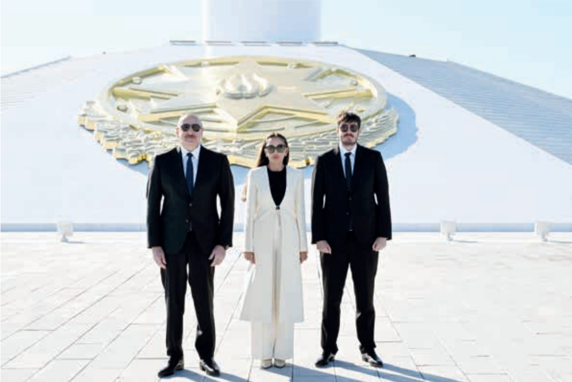
Azərbaycan Respublikasının Prezidenti İlham Əliyev, birinci xanım Mehriban Əliyeva və oğulları Heydər Əliyev noyabrın 8-də Bakıda Dövlət Bayrağı Meydanında olublar.

Dövlətimizin başçısı burada Azərbaycanın üçrəngli Bayrağını ucaldıb.