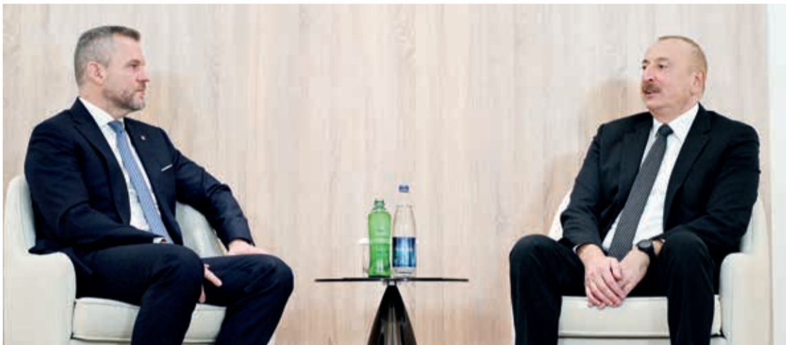
Azərbaycan Respublikasının Prezidenti İlham Əliyev noyabrın 11-də Slovakiya Respublikasının Prezidenti Peter Pelleqrini ilə görüşüb.

Qonaq Azərbaycanın, o cümlədən Bakı şəhərinin inkişafını məmnunluqla qeyd etdi.