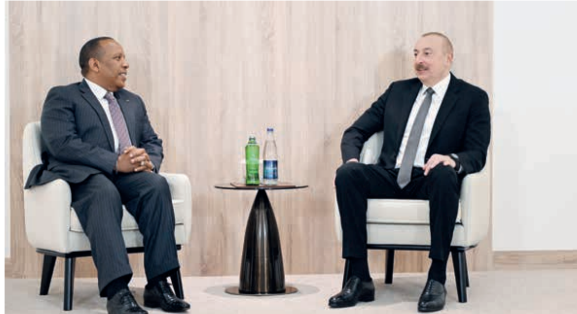
Azərbaycan Respublikasının Prezidenti İlham Əliyev noyabrın 10-da San-Tome və Prinsipi Demokratik Respublikasının Baş naziri Patris Emeri Trovoada ilə görüşüb.

San-Tome və Prinsipi Demokratik Respublikasının Baş nazirinin ölkəmizə səfərinin ikitərəfli münasibətlərdə ilk səfər olduğunu deyən dövlətimizin başçısı onun əhəmiyyətinə toxundu.