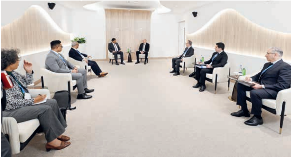
Azərbaycan Respublikasının Prezidenti İlham Əliyev noyabrın 10-da Surinam Respublikasının Prezidenti Çandrikapersad Santoxi ilə görüşüb.

Surinam Prezidenti ilə görüşdən məmnunluğunu bildirən dövlətimizin başçısı Çandrikapersad Santoxinin dəvəti qəbul edib, COP29 tədbirində iştirak etdiyinə görə minnətdarlığını bildirdi və vurğuladı ki, bu, ikitərəfli münasibətlərimizdə yüksək səviyyədə ilk rəsmi səfərdir. Azərbaycan Prezidenti bu səfərin əlaqələrimizin perspektivləri barədə fikir mübadiləsinin aparılması üçün yaxşı imkan yaratdığını qeyd edərək, onun səmərəli nəticələr verəcəyinə ümidvarlığını bildirdi.