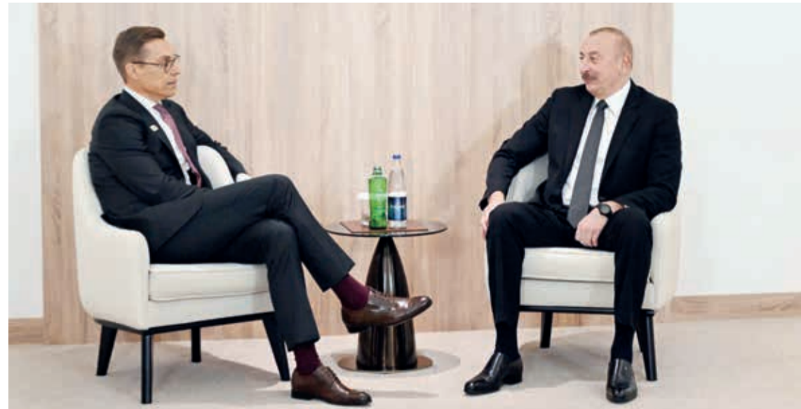
Azərbaycan Respublikasının Prezidenti İlham Əliyev noyabrın 11-də Finlandiya Respublikasının Prezidenti Aleksandr Stubb ilə görüşüb.

Gələcək il Finlandiyanın ATƏT-in fəaliyyətində olan sədri funksiyasını özünə götürəcəyini deyən Aleksandr Stubb Helsinki Yekun Aktının 50 illiyinin qeyd olunacağını vurğuladı.