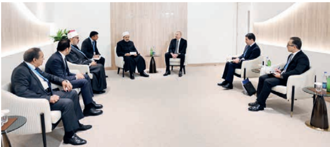
Azərbaycan Respublikasının Prezidenti İlham Əliyev noyabrın 11-də Əl-Əzhəri Şərifin şeyxi, böyük imam Əhməd Məhəmməd Əhməd Əl Tayyib ilə görüşüb.

Prezident İlham Əliyev davatı qəbul edib COP29-da iştirakına görə Əl-Əzhəri Şərifin şeyxi, böyük imam Əhməd Məhəmməd Əhməd Əl Tayyibə minnətdarlığını bildirdi, onun burada olmasının bu tədbiri xüsusilə əhəmiyyətli etdiyini dedi.