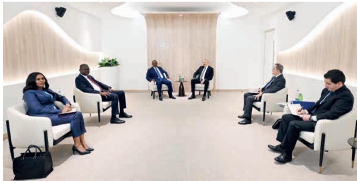
Azərbaycan Respublikasının Prezidenti İlham Əliyev noyabrın 10-da Qvineya-Bisau Respublikasının Prezidenti Umaru Sisoku Embaló ilə görüşüb.

Qvineya-Bisau Prezidenti COP29-un yüksək səviyyədə təşkilinə və göstərilən qonaqpərvərliyə görə dövlətimizin başçısına təşəkkürünü bildirdi, bu tədbirin uğurla keçəcəyinə əminliyini ifadə etdi.