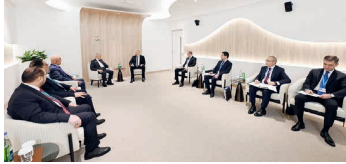
Azərbaycan Respublikasının Prezidenti İlham Əliyev noyabrın 11-də İraq Respublikasının Prezidenti Əbdüllətif Camal Rəşid ilə görüşüb.

İqlim dəyişmələri və ətraf mühit məsələlərinə xüsusi önəm verdiklərini deyən İraq Prezidenti iqlim dəyişmələri mövzusunda əldə olunmuş razılaşmanın icrasının vacibliyinə toxundu. Qonaq müharibələrin və hərbi münaqişələrin ətraf mühitə ən böyük təhlükə yaratdığını dedi. Əbdüllətif Camal Rəşid ölkəsinin COP29-da geniştərəfli nümayəndə heyəti ilə təmsil olunduğunu vurğuladı. İraq Prezidenti ikitərəfli əlaqələrimizin uğurlu inkişaf etməsindən məmnunluğunu bildirdi.