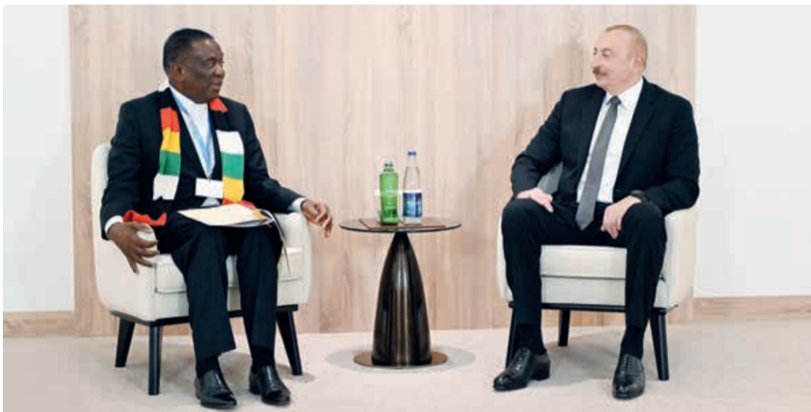
Azərbaycan Respublikasının Prezidenti İlham Əliyev noyabrın 10-da Zimbabve Respublikasının Prezidenti Emmerson Dambudzo Mnanangva ilə görüşüb.

Dövlətimizin başçısı Zimbabve Prezidentinin COP29-da iştirakına görə minnətdarlığını bildirdi.