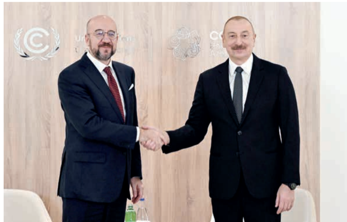
Azərbaycan Respublikasının Prezidenti İlham Əliyev noyabrın 11-də Avropa İttifaqı Şurasının Prezidenti Şarl Mişel ilə görüşüb.

COP29-un Azərbaycanda keçirilməsi münasibətilə təbriklərini çatdıran və bununla bağlı uğurlar arzulayan Şarl Mişel bu tədbirdə iqlim dəyişmələri ilə əlaqədar vacib qərarların qəbul ediləcəyinə ümidvarlığını ifadə etdi.