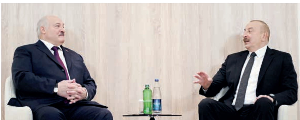
Azərbaycan Respublikasının Prezidenti İlham Əliyev noyabrın 11-də Belarus Respublikasının Prezidenti Aleksandr Lukaşenko ilə görüşüb.

Dövlətimizin başçısı Prezident Aleksandr Lukaşenonun dəvəti qəbul edib COP29 tədbirində iştirakına görə minnətdarlığını bildirdi.