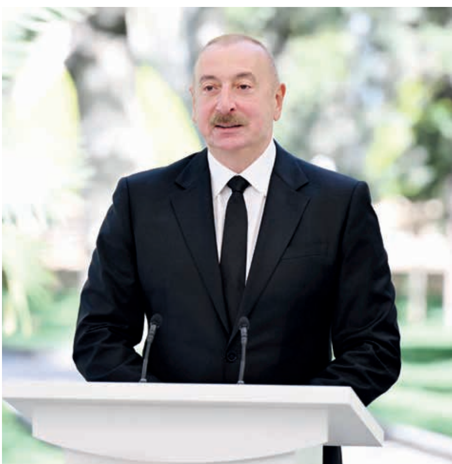
Azərbaycan Respublikasının Prezidenti İlham Əliyev və oğlu Heydər Əliyev sentyabrın 30-da Bakıda Azərbaycan aşıq yaradıcılığının görkəmli nümayəndəsi, böyük el sənətkarı Aşıq Ələsgərin abidəsinin açılışında iştirak ediblər. Dövlətimizin başçısı tədbirdə çıxış etdi.