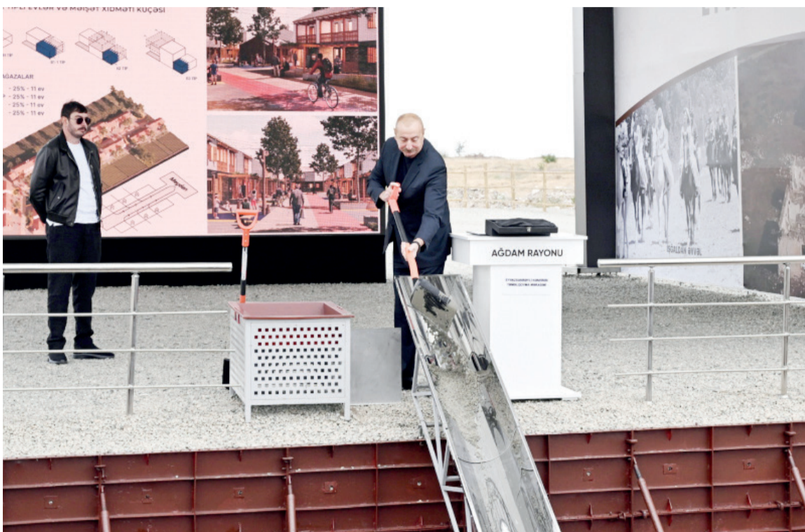
Azərbaycan Respublikasının Prezidenti İlham Əliyev və oğlu Heydər Əliyev sentyabrın 19-da Ağdam rayonunun Eyvaxanbəyli kəndinin təməlqoyma mərasimində iştirak ediblər.

Ağdam, Füzuli və Xocavənd rayonlarında Azərbaycan Respublikası Prezidentinin xüsusi nümayəndəsi Emin Hüseynov dövlətimizin başçısına kənddə görüləcək işlər barədə məlumat verdi.