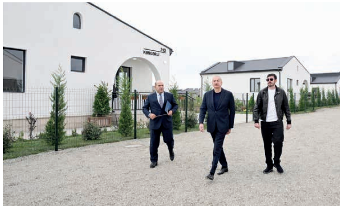
Azərbaycan Respublikasının Prezidenti İlham Əliyev sentyabrın 19-da Ağdam rayonunun Kəngərli kəndində aparılan bərpa işləri ilə tanış olub.

Dövlətimizin başçısına kənddə görülən işlər barədə məlumat verildi.