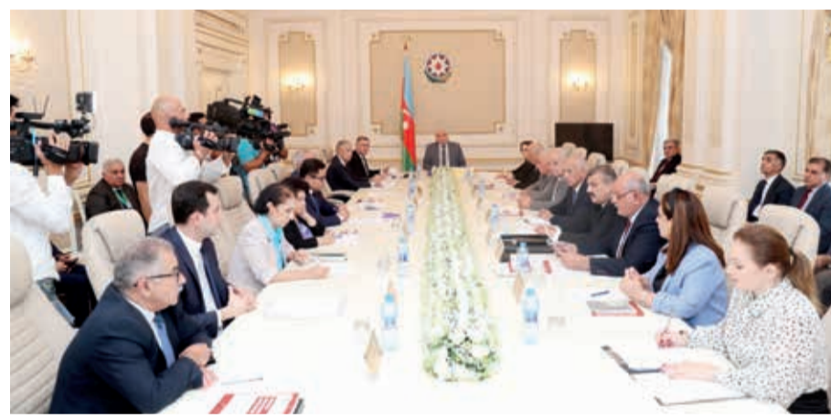
Sentyabrın 11-də Məzahir Pənahovun sədrliyi ilə Mərkəzi Seçki Komissiyasının (MSK) növbəti iclası keçirilib.

MSK-nin sentyabrın 10-da keçirilmiş iclasının protokolu təsdiqlənib.