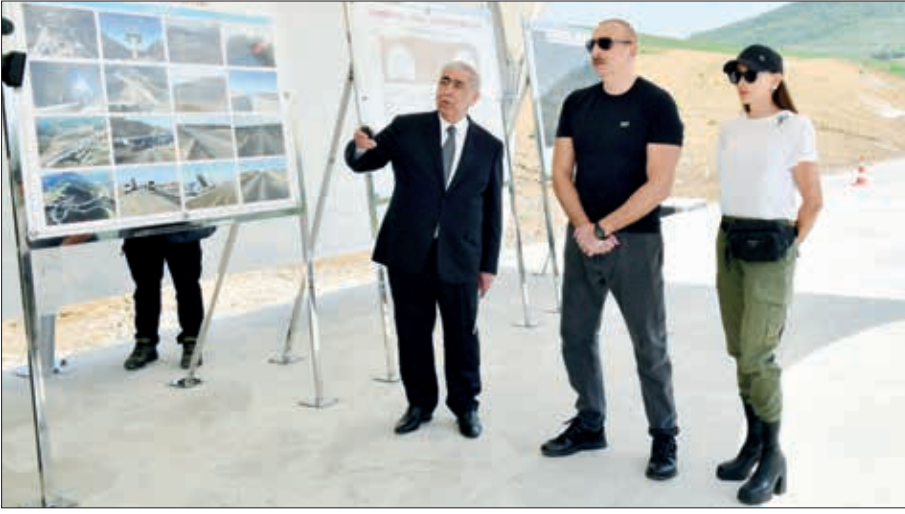
(əvvəlki 1-ci səhifədə)

Bildirildi ki, başlanğıcını M6 Hacıqabul-Horadiz-Ağbend-Zəngəzur dəhlizi magistral avtomobil yolundan götürməklə işğaldan azad edilən Füzuli, Xocavənd, Xocalı və Şuşa rayonlarını birləşdirən 81,7 kilometr uzunluğundakı Əhmədbəyli-Füzuli-Şuşa avtomobil yolunun beynəlxalq magistral normalarına uyğun tikintisi sürətlə davam etdirilir. Yolun 66-81-ci kilometrliyində işlərin 85 faizi başa çatıb. Uzunluğu 15,72 kilometr olan bu hissədə yolun hərəkət sahəsinin eni 10,75 metr, torpaq yatağının eni isə 21,5 metrdir. Dövlətimizin başçısının tapşırığına əsasən, Əhmədbəyli-Füzuli-Şuşa avtomobil yolu Qarabağın inkişaf planı nəzərə alınaraq, dörd hərəkət zolaqlı olmaqla 1b texniki