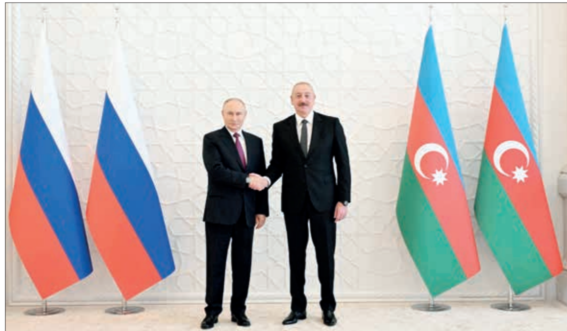
Azərbaycan Respublikasında dövlət səfərində olan Rusiya Federasiyasının Prezidenti Vladimir Putinin avqustun 19-da rəsmi qarşılanma mərasimi olub. Hər iki ölkənin Dövlət bayraqlarının dalğalandığı meydanda Rusiya Prezidentinin şəərəfinə fəxri qarovul dəstəsi düzülüb. Azərbaycan Prezidenti İlham Əliyev Rusiya