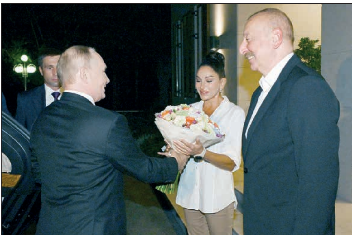
Rusiya Federasiyasının Prezidenti Vladimir Putin avqustun 18-də Azərbaycana dövlət səfərinə gəlib. Azərbaycan Respublikasının Prezidenti İlham Əliyev və birinci xanım Mehriban Əliyeva evlərində Rusiya Prezidenti Vladimir Putinlə şam ediblər.

Prezident İlham Əliyev və birinci xanım Mehriban Əliyeva evlərində Rusiya Prezidenti Vladimir Putinlə şam ediblər